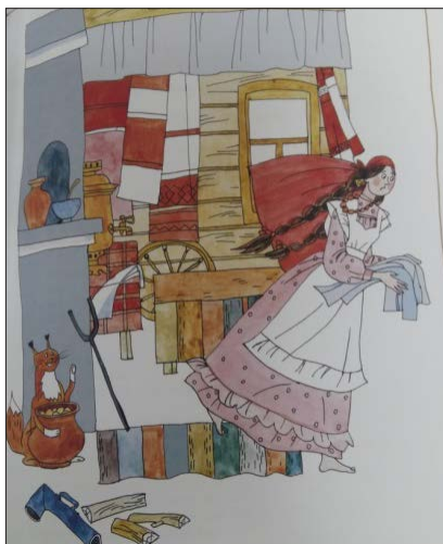
Диләрә Нәүрузова рәсеме

Әлеге әкияткә берничә рәссамыбыз иллюстрацияләр эшлән- гән. Дәреслектә рәссам Диләрә Нәүрузованың рәсеме урын