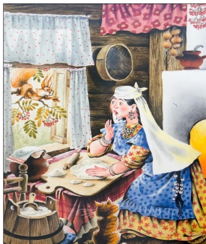
Фәридә Хәсъянова рәсеме