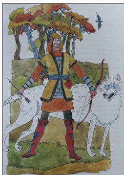
Дилэрэ Нәүрузова рәсеме