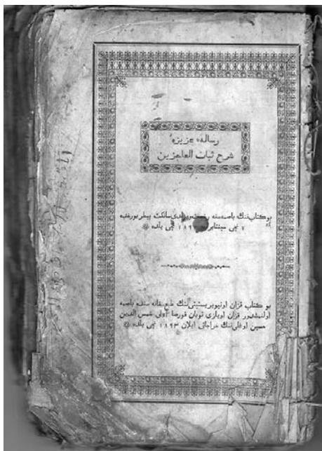
«Рисаләи Газизә» китабының титул бите

Бу ике әдип кайда гына туып яшәмәсен, әсәрләре кайда гына язылмасын, күчерелмәнөсхәләре Казан артында табылу һәм әби-бабаларыбыз тарафыннан укылган булуы – бу аларга булган рухи ихтыяж турында сөйли. Әлегә ике китап музейебызның язма чыганаclar һәм фотодокументлар фондында алыштыргысыз мирас булып саклана.